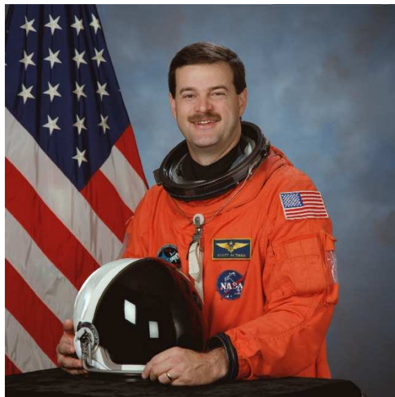
Offizielles NASA Portrait von Scott D. Altman in seinem Raumanzug für Start und Landung.

Seine erste Mission flog Scott Altmann als Pilot der Mission STS-90 „Neurolab“ vom 17. April bis 3. Mai 1998. Bei diesem Flug der Raumfähre Columbia kam das europäische Weltraumlabor Spacelab zu seinem 22. und letzten Einsatz. Bei der „Neurolab“ Mission wurden Untersuchungen an Menschen und Tieren im Bezug auf die Gehirnfunktionen durchgeführt. Es wurde beispielsweise die Koordination von Hirn- und Körperbewegungen erforscht oder die Funktion des Gleichgewichtssinns. Als Pilot der Mission STS-106 an Bord der Raumfähre Atlantis flog er vom 8. bis 20. September 2000 seine zweite Mission. Die Hauptaufgabe der Mission war es die Internationale Raumstation mit diversen Gebrauchsgegenständen und Versorgungsgütern auf die Ankunft der 1. Stammesatzung (Expedition 1) vorzubereiten sowie Montagearbeiten außerhalb der Station durchzuführen.