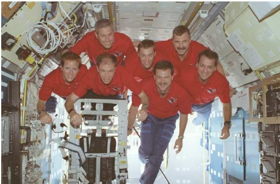
Die STS-90 Besatzung schwebt im Spacelab Wissenschaftsmodul im Erdorbit.

Es gibt dafür grundsätzlich einige Gründe warum wir erst am dritten Flugtag an die Raumstation ankoppeln. Wenn sie am ersten Flugtag bereits die Raumstation erreichen wollen gibt es gewisse Zeitvorgaben die sie erfüllen müssen und dadurch nicht täglich starten können. Ein weiterer Grund für ein Rendezvous am dritten Flugtag ist das viele Systeme der Raumfähre für den Start konfiguriert sind. Beispielsweise sind alle Sitze installiert oder die ganzen Computer noch nicht aufgebaut sind und die Foto- und TV Kameras für das Rendezvous und Andocken noch nicht vorbereitet sind. Es sind sehr viele zeitintensive Arbeiten und Vorbereitungen durchzuführen um die Raumfähre von der Startkonfiguration in ein Raumschiff zu versetzen. Ein weiterer Grund dafür ist es der Besatzung etwas Zeit zu geben um sich an die Schwerelosigkeit anzupassen.