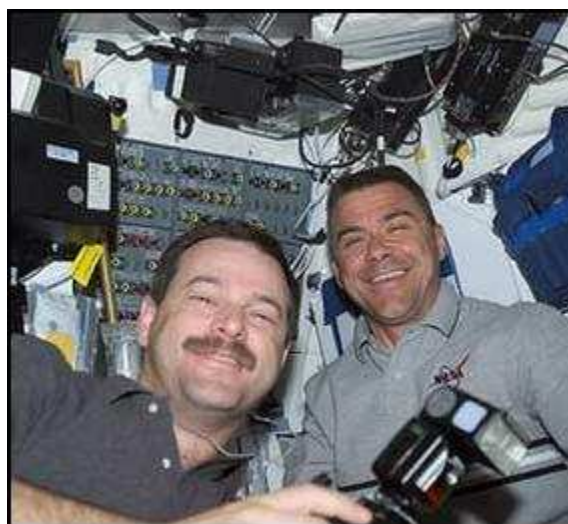
Kommandant Scott Altman und Pilot Duane Carey im Flugdeck der Raumfähre Columbia während der Mission STS-109.

Ja! Wir führten durch mehrere Zündungen der Steuerdüsen, die vom Missionskontrollzentrum berechnet wurden, einige Manöver durch um uns Hubble zu nähern. Als wir uns bis auf etwa 45 Kilometer näherten nutzten wir das Radar der Raumfähre und berechneten damit unsere weiteren Zündungen um uns dem Teleskop soweit zu nähern um es mit dem Roboterarm einzufangen. Die letzten 1000 Meter bin ich dann manuell geflogen. Hubble ist etwas schwerer anzufliegen als die Internationale Raumstation. Die Raumstation hat einige Reflektoren und einen kleinen Laser um die genaue Entfernung zu berechnen und das ist eine hilfreiche Unterstützung für das Rendezvous. Das Hubble Teleskop besitzt keines dieser Systeme deshalb mussten wir das Radar benutzen sowie einen tragbaren Laser. Von diesem System bekommen sie aber keine beständigen Daten und das macht das Rendezvous umso schwieriger. Als Kommandant möchten sie natürlich genaue Daten haben um genaue Zündungen der Steuerdüsen durchzuführen aber wenn sie diese bedingt zur Verfügung haben ist es eine Mischung aus den erhaltenen Daten und dem eigenen Gefühl die richtigen Entscheidungen für das Rendezvous zu treffen.