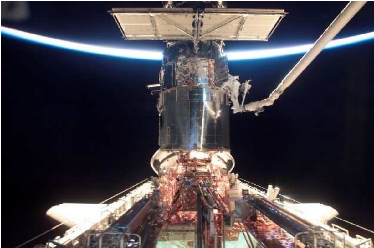
Das Hubble Weltraumteleskop im Laderaum der Raumfähre Columbia während des ersten Außenbordeinsatzes. Astronaut Michael Massimino steht am Ende des Roboterarms.

Führen Sie das Rendezvous rein nach den Monitoren durch die sie zur Verfügung haben oder auch auf Sicht durch die hinteren Fenster des Flugdecks der Raumfähre?