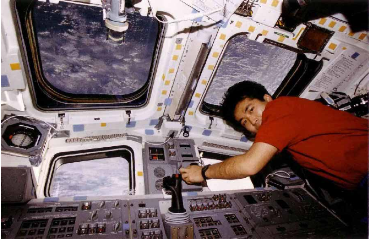
Koichi Wakata bedient während seiner ersten Mission STS-72 den Roboterarm (RMS) im hinteren Flugdeck der Raumfähre Endeavour.

benutzten, um die Instrumente und Schalter der hinteren Instrumententafel zu kontrollieren, durch die beiden Fenster oben nach draußen schauen. In diesem Spiegel konnte ich durch das Fenster die Startrampe sehen und verfolgen, wie wir gestartet sind. Beim Start war es durch die etwa 200 m langen Flammen der Feststoffraketen taghell. Der Blick war großartig, und was mich besonders überrascht hat, war diese starke Vibration in den ersten beiden Minuten. Als die Luft dann immer dünner wurde, näher zur Erdatmosphäre hin, sah ich Blitze, wie bei einem Gewitter. Solch einen Blitz habe ich niemals bei den Simulationen gesehen, die wir gemacht haben. Der Aufstieg war fantastisch und mit 8½ Minuten sehr kurz.