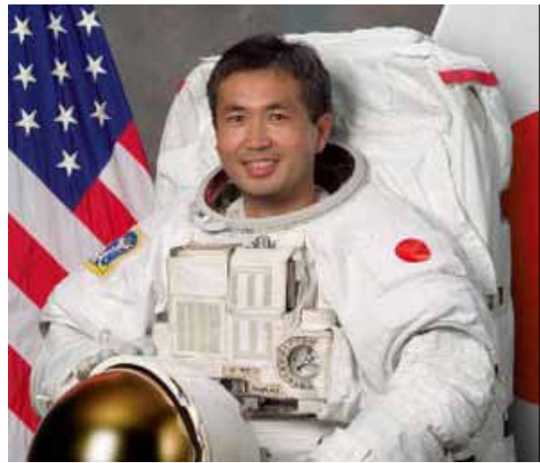
Portrait von 2007 von Koichi Wakata in seinem Raumanzug (EMU) für Außenbordeinsätze.

In den Weltraum zu fliegen, war für mich immer ein Traum, nachdem ich im Alter von fünf Jahren die erste Apollo Mondlandung gesehen habe. Zu dieser Zeit dachte ich, dass nur amerikanische oder sowjetische Astronauten ins All fliegen können, da es noch keine japanischen Astronauten gab. Deshalb dachte ich, dass der Beruf des Astronauten für mich wohl unerreichbar ist. Ich habe mich als Kind sehr für Flugzeuge interessiert und habe Papierflugzeuge, Modellflugzeuge