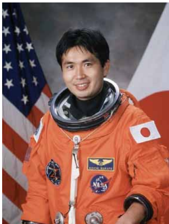
Portrait von 1999 Koichi Wakata in seinem orangefarbenen Raumanzug (ACES) für den Start und die Landung mit dem Space Shuttle.

Im Februar 2007 wurde er als Bordingenieur für die Langzeitbesatzung Expedition 18 zur Inter-nationalen Raumstation nominiert, die für Ende 2008 geplant ist.