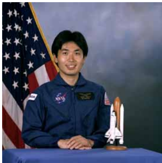
Portrait von 1992 von Koichi Wakata in seinem blauen Fliegeroverall als Astronauten-kandidat.

1989 begann er seine Arbeit als Ingenieur bei der japanischen Fluglinie Japan Airlines (JAL). Im Juni 1992 wurde er als Astronautenanwärter von der Japanischen Raumfahrtagentur NASDA ausgewählt, und im August 1992 begann er seine Ausbildung im Johnson Space Center in Houston in Texas. Nach seiner Ausbildung zum Missionsspezialisten arbeitete er jeweils einige Monate in den Bereichen für Missionsvorbereitungen und Verifizierung der Space Shuttle Flugsoftware, bevor er für etwa 10 Jahre im Bereich der Robotertechnik sowie parallel 5 Jahre im Entwicklungsbereich der Außenbordeinsätze eingesetzt war.